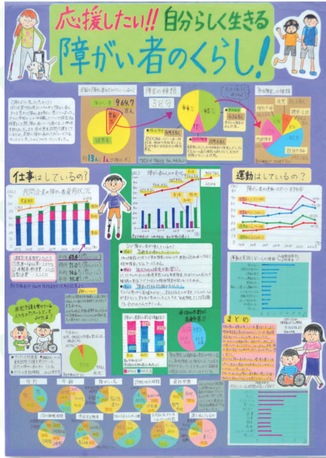
東京都教育委員会賞

グラフコンクールの募集が始まります！ (6月中に開始予定) 奮ってご応募ください。 詳しくは「東京都の統計」HPを見てね！